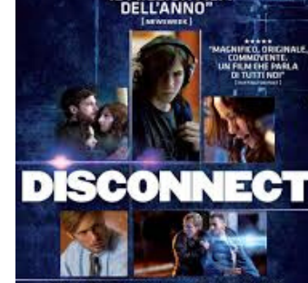
TRUFFE, CYBERBULLISMO, CYBERSESSO