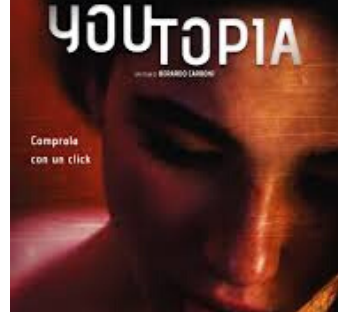
CORPO IN VENDITA

MA DA VEDERE PRIMA SOLO TRA GENITORI PERCHÉ NON TUTTI SONO ADATTI A TUTTE LE ETÀ